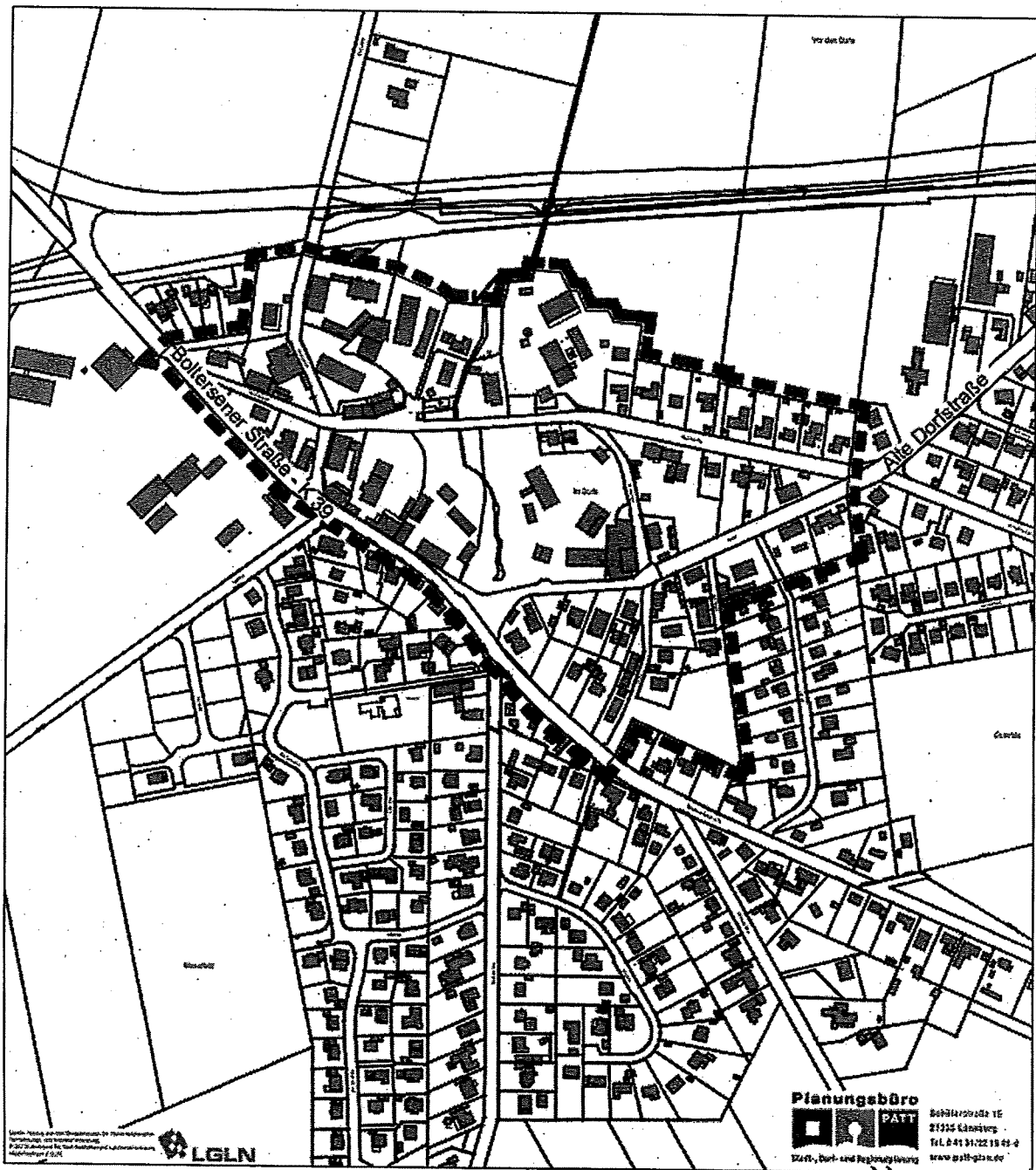
Übersichtsplan, ohne Maßstab